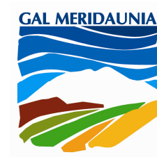
Tavola rotonda “La formazione e l’innovazione per lo sviluppo rurale nei paesi del Mediterraneo”