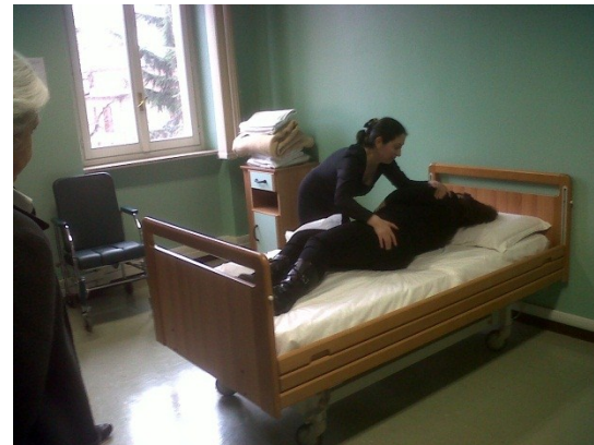
Sessione di accertamento Engim - Torino

Il sistema di partenza è fortemente ECVET compatibile: con adattamenti minimi si perviene a prassi condivise a livello europeo