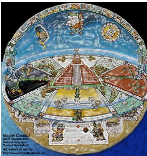
Mayan Cosmos based on March 1990 National Geographic "Ancient Diagrams" Art revised for web by http://www.edwardtobinski.us/ Copyright: Armonia delle sfere s.a.s. 2011-12

Sono diverse le esperienze di innovazione, degli ultimi anni, volte a promuovere processi di inclusione sociale per giovani, anziani, emigrati, disabili, persone in condizioni di disagio.